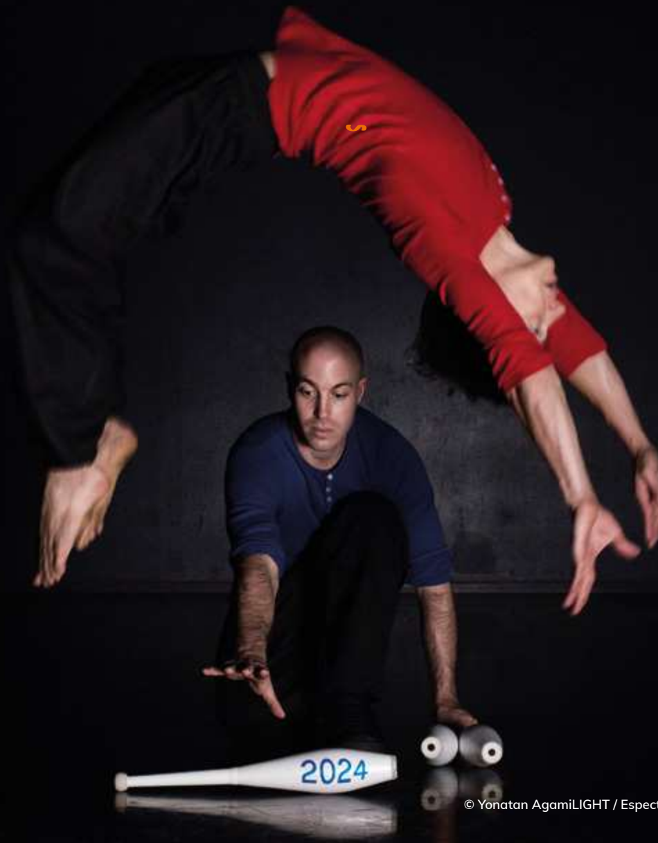
© Yonatan AgamiLIGHT / Espectáculo LAZUZ